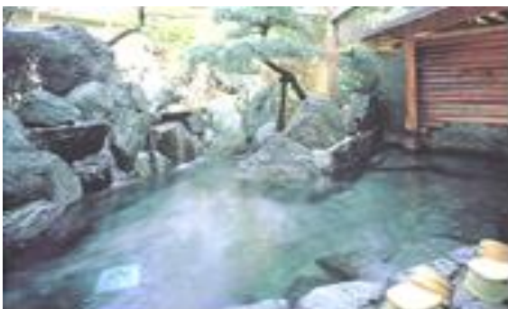
大岩大浴場や庭園露天風呂、ハーブ湯などお楽しみください